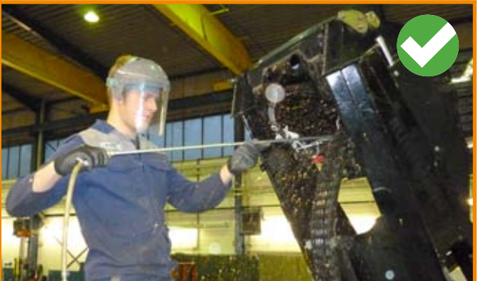
Reinigung eines Auslegersystems mit spezieller Druckluftlanze!

Werden Ansammlungen von Sägespänen im Trägersystem festgestellt, so sind diese durch autorisiertes Personal vorsichtig zu entfernen.